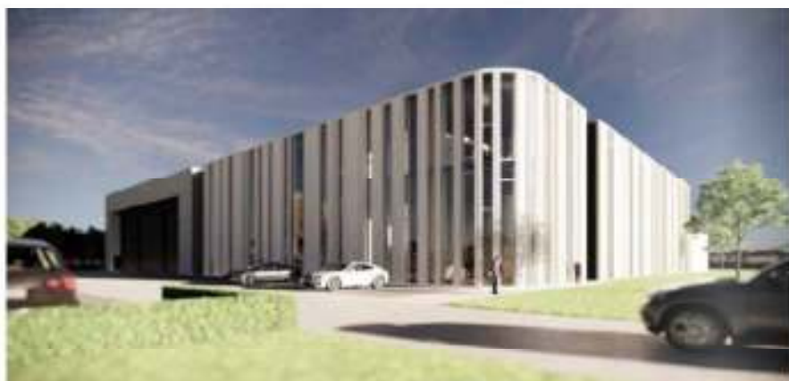
De state of the art productiehal van Stjlbeton

Stjlbeton gaat er steeds voor op dat het nog meer en meer kan produceren in verbetert, onder heel dankzij een nieuw proces op basis van kunststofmaterialen. Maar om de wijd, door te nemen vaak onvermoeide mogelijkheden van beton naauwkeurig te kunnen vertolken, is plaats nodig 'heel plaats'. Om daarom te kunnen voorzien, stond een uitbreiding met een nieuwe productiehal dicht op. Deze laatste is geen voor een oppervlakte van een 4000 m² en wordt bovendien uitgebreid met een nieuwe kantoorruimte. De oorspronkelijke productiehal van 3000 m² zal in de toekomst waarschijnlijk gebruikt worden als aanvullende schrijfwinkel, opslagruimte en opslagruimte voor afgewerkte betonproducten.