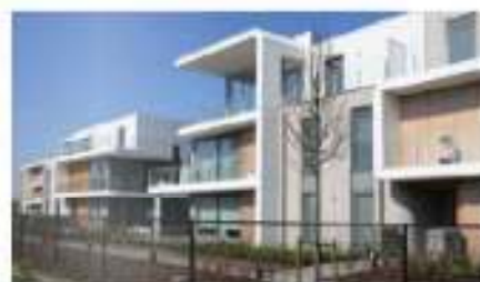
Deze laatste nieuwe realisatie van Stjlbeton beschrijft de huidige waf van de huidige kantoren.